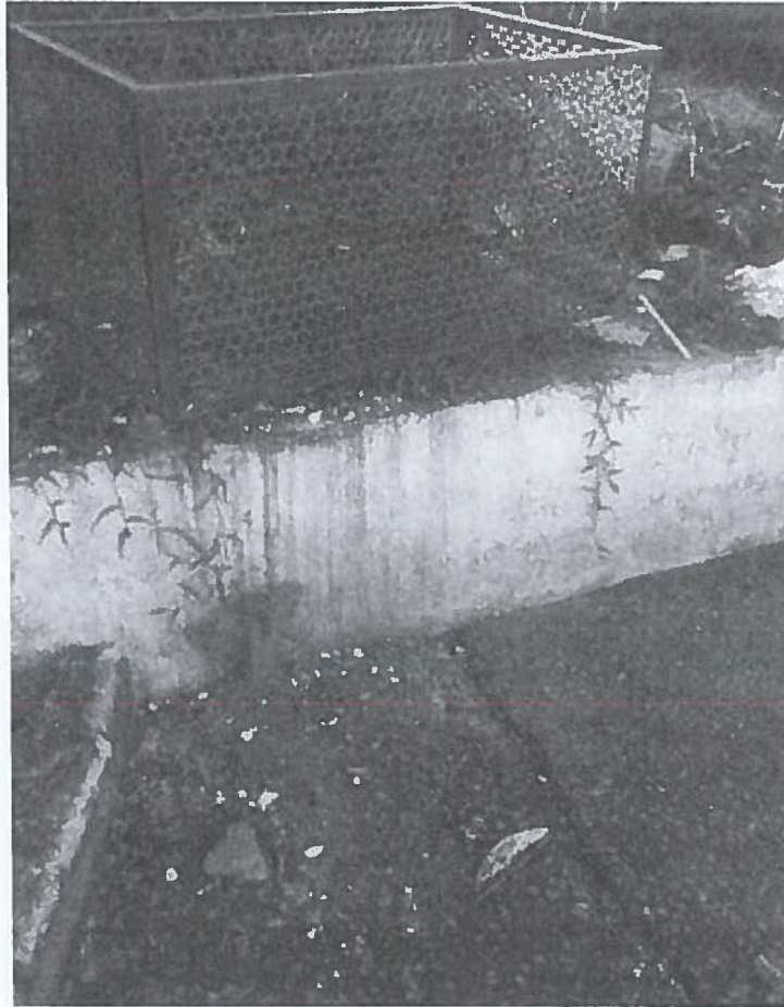
Lixeira localizada na Rua São Roque, bairro Vila Aparecida.

CÂMARA MUNICIPAL DE MARIANA APROVADO POR UNANIMIDADE